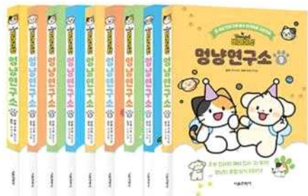
콘텐츠 IP 사업화 사례 - 도서