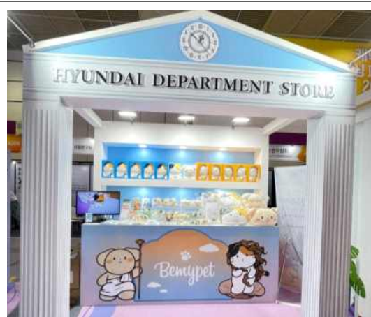
콘텐츠 IP 사업화 사례 - 팝업/굿즈