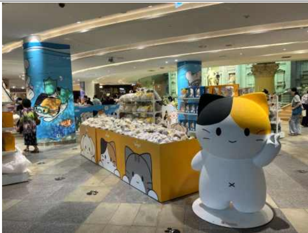
콘텐츠 IP 사업화 사례 - 팝업/굿즈