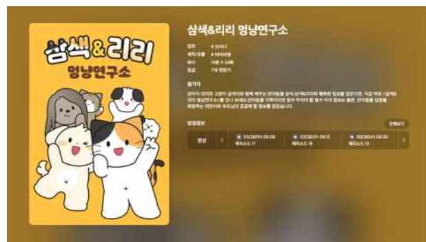
콘텐츠 IP 유통 사례 - 애니맥스 TV