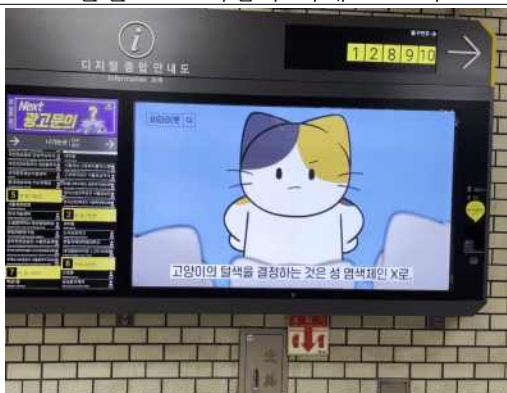
콘텐츠 IP 유통 사례 - 지하철역/버스